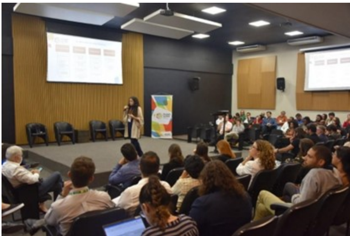
Participantes do Workshop em palestra sobre EbA

No dia 29 de maio, o Ministério do Meio Ambiente e Mudança do Clima (MMA), o Ministério da Ciência, Tecnologia e Inovação (MCTI) e o Projeto ProAdapta-GIZ organizaram um importante workshop para o desenvolvimento do Plano de Adaptação às Mudanças Climáticas.